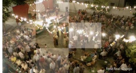
Feria Real / Espejo