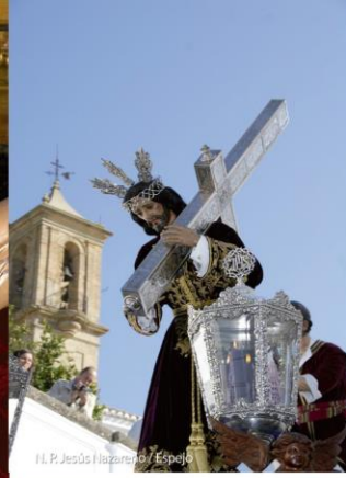
N. P. Jesús Nazareno / Espejo

A continuación se indican algunos de los aspectos más destacados de la oferta relacionada con las manifestaciones culturales, sociales y artísticas que se desarrollan en estos municipios: