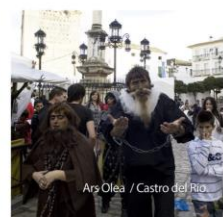
Ars Olea / Castro del Río