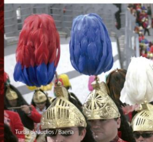
Turba de Judíos / Baena

Destaca la importancia de la Semana Santa. De primordial importancia en el elenco de tradiciones festivas de todos los municipios, cabe detenerse en las peculiaridades que cada localidad ofrece de esta festividad a que trasciende el aspecto religioso e impregna la totalidad de la vida de sus gentes. Así la Semana Santa de Baena , declarada de Interés Turístico Nacional, donde destaca la figura emblemática del Judío con su inseparable tambor que llena de sonido y colorido toda la localidad desde que se inicia la Cuaresma. Pero además destacan el casi centenar de hermandades que durante la Semana de Pasión llevan a cabo un festivo ceremonial religioso que distingue esta Semana Santa de las restantes celebraciones andaluzas. Durante todo el año estas figuras y tradiciones pueden contemplarse en el Museo de la Semana Santa existente en la localidad.