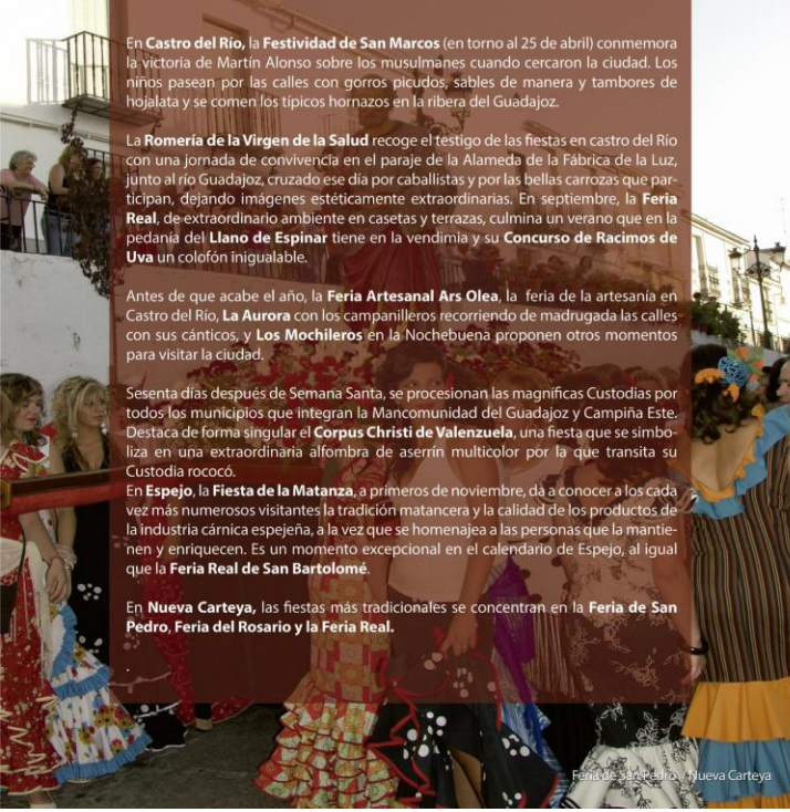
Feria de San Pedro / Nueva Carteya

En Nueva Carteya , las fiestas más tradicionales se concentran en la Feria de San Pedro , Feria del Rosario y la Feria Real .