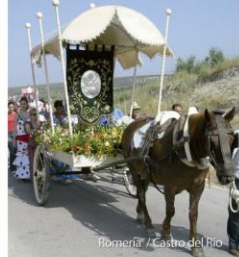
Romería / Castro del Río